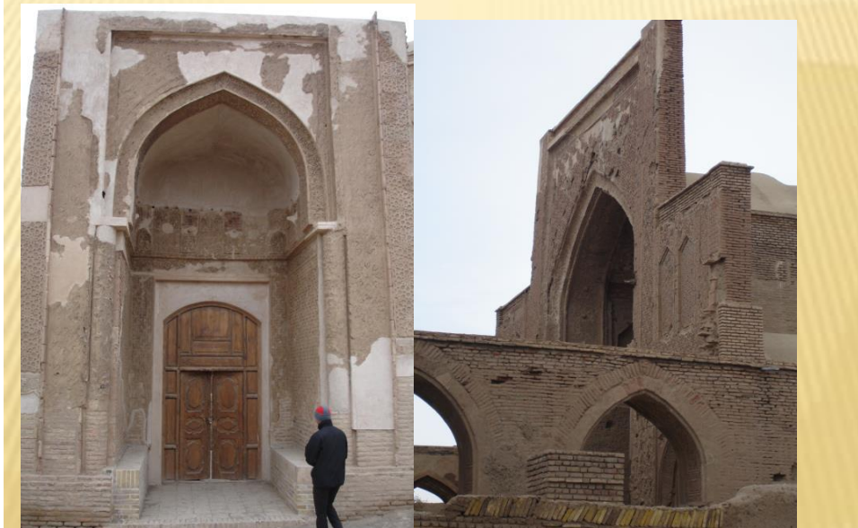
مسجد جامع فرومد